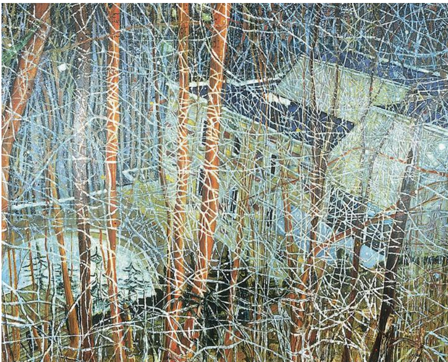
Peter Doig, Öl auf Leinwand 1991, 200 x 275 cm