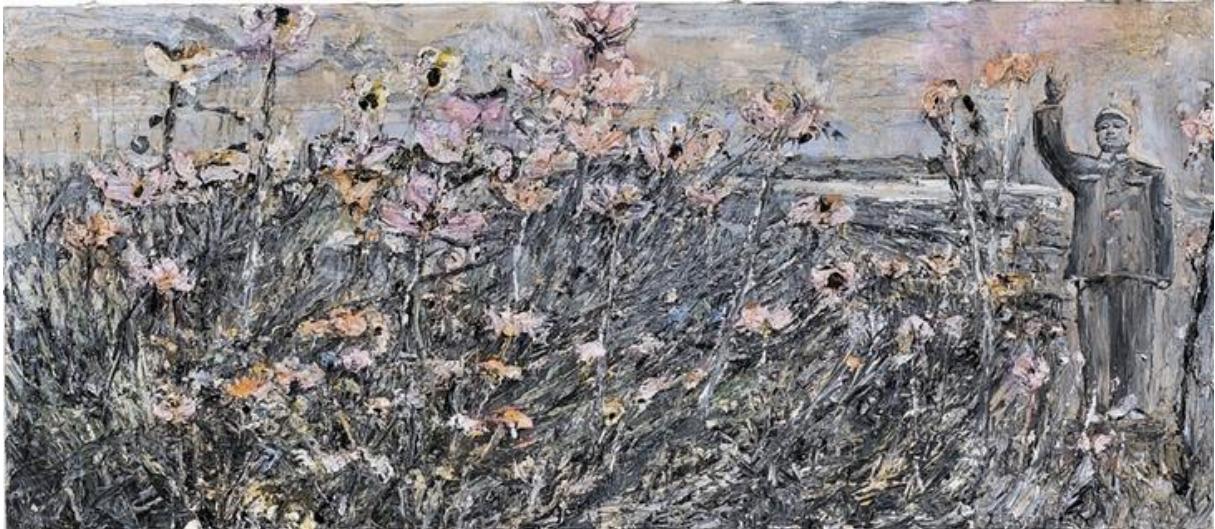
Anselm Kiefer, Ohne Titel, 2012, Öl, Emulsion und Kreide auf Leinwand, 250 x 585 x 8 cm

Erstelle eine Zeichnung (DIN A4) mit unterschiedlichen Graustufen (unterschiedliche Bleistifte) - beziehe dich dabei auf verschiedene Linienarten. ----- -----